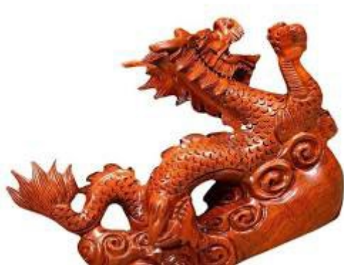
Skulptūra ant lentynos