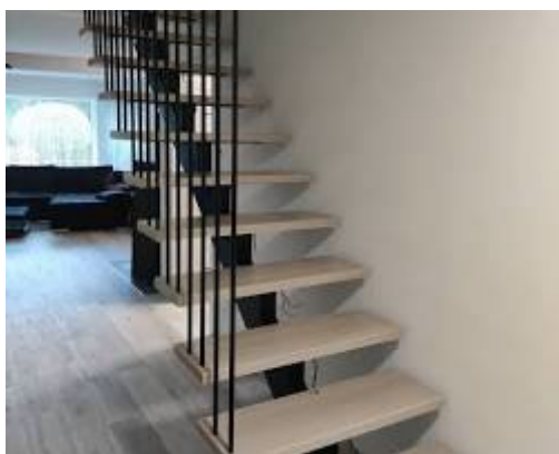
Atidaroma naujame lange