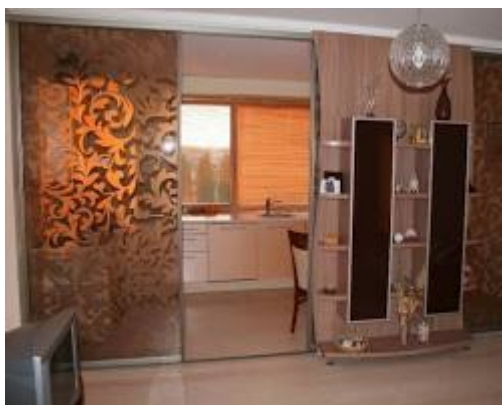
Atidaroma naujame lange