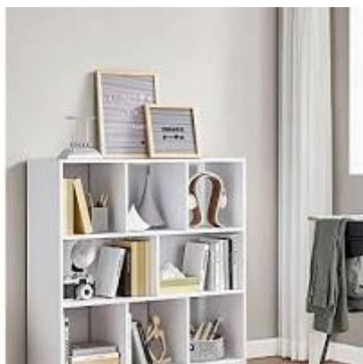
Sieninės lentynos su knygomis ir dekoracijomis