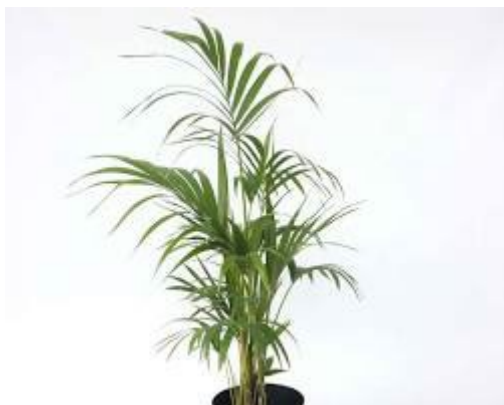
Didelis kambarinis augalas kampe