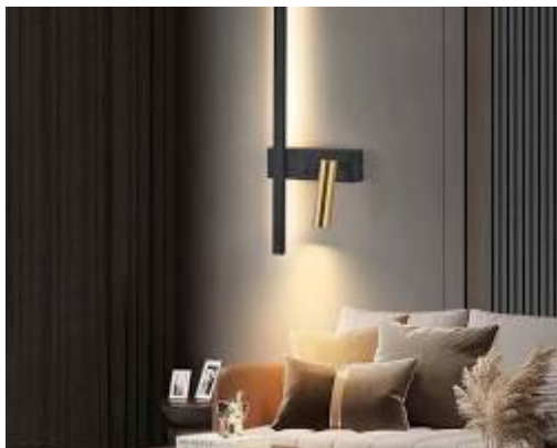
Sieniniai šviestuvai virš lovos