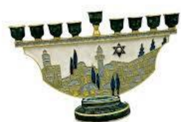
Žvakidės su degančiomis žvakėmis