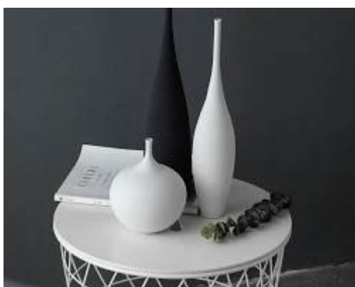
Vazos su gėlėmis ant kavos staliuko