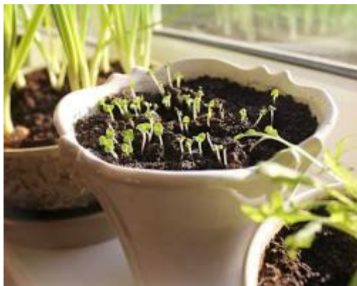
Žolelių vazonėliai ant virtuvės palangės