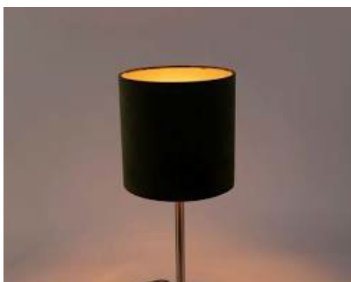
www.lempairsviesa.lt Stalo lempa su stilingu abajur