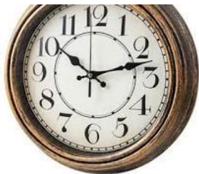
Senovinis laikrodys ant sienos