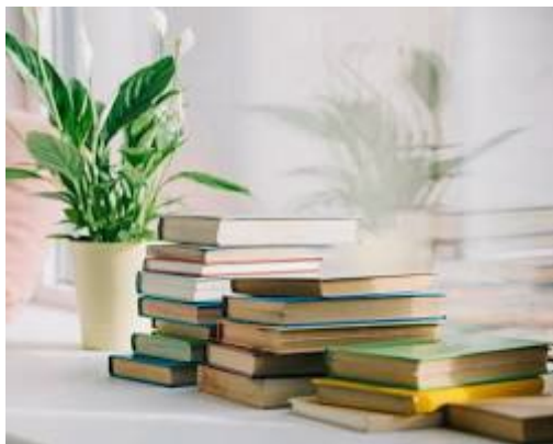
Knygos sudėtos ant kavos staliuko