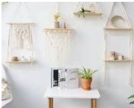
Medinės lentynos svetainėje